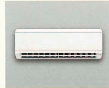
エアコン工事 最大24,000円