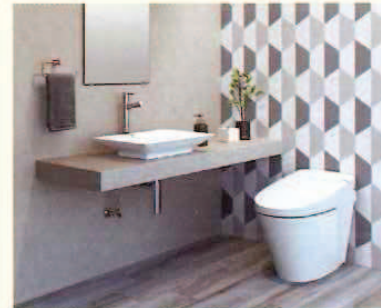
トイレ改修 最大20,000円