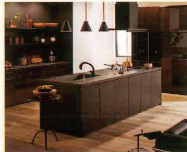
キッチン改修 最大51,000円